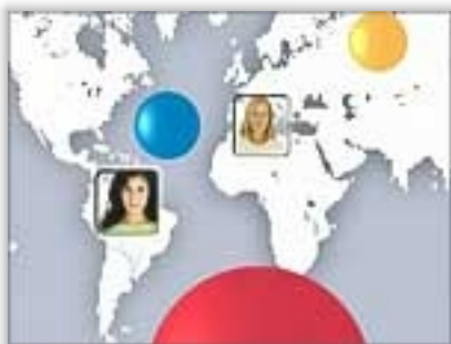
Campaña "Alguien en el mundo puede estar necesítandote" año 2007

Las campañas desarrolladas por el Incucai comprenden diversas líneas de acción: afiches en la vía pública, atención de una línea telefónica gratuita, página Web, entrega de materiales impresos, stands de promoción. Éstas son sólo algunas de las acciones que se despliegan para transmitir mensajes a favor de la donación de órganos, tejidos y células. Como parte de la publicidad de las campañas también se difunden spots en radio y televisión medios que por su naturaleza tienen una repercusión masiva- para acercar el tema de la donación y el trasplante a la ciudadanía.